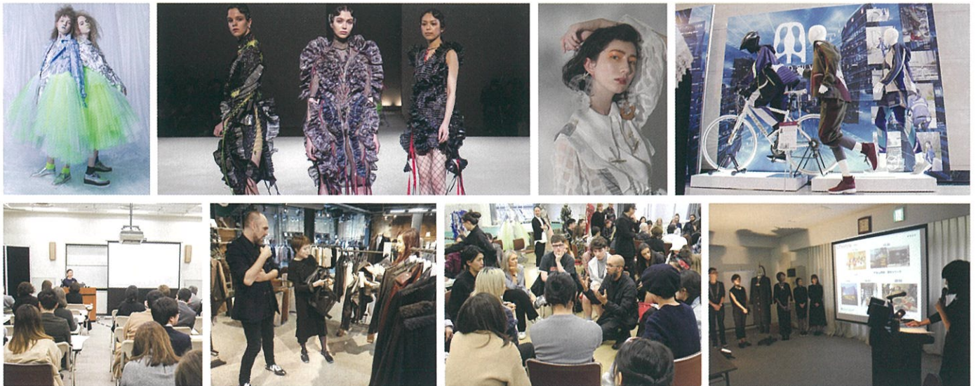
(上段左から) ファッションデザインコース2年次修了作品 / ファッションデザインコース2年次修了コレクション / ファッションテクノロジーコース2年次修了作品 / ファッションテクノロジーコース2年次修了作品展示 (下段左から) ファッション経営管理コース2年次修了研究発表 / ファッション経営管理コース海外視察研修 / イギリス・サルフォード大学との交流 / 全コース合同で行う科目「ファッションビジネスメソッド」発表の様子