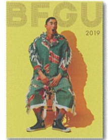
最新の入学案内を配布!